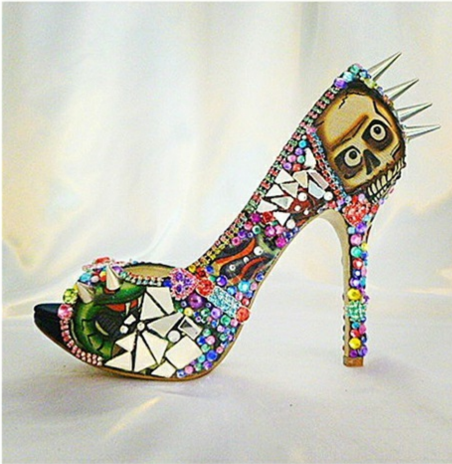
ДругойЭштон Как тебе, @ГрейсВЭФИРЕ? Слишком изысканно? #ОнаНастроенаСерьезно #каблуки-убийцы #Этси #ВечнаяМода