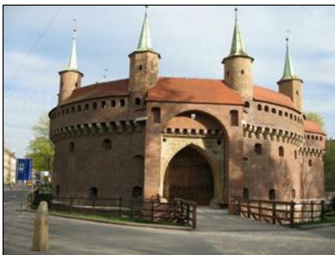
Барбакан (метров 80 от Флорианских ворот)

На лавке неподалеку сидел мужчина, одетый в дорогой костюм. На запястье сиял золотой швейцарский хронометр. Мужик пил всю ночь, сейчас постепенно приходил в себя.