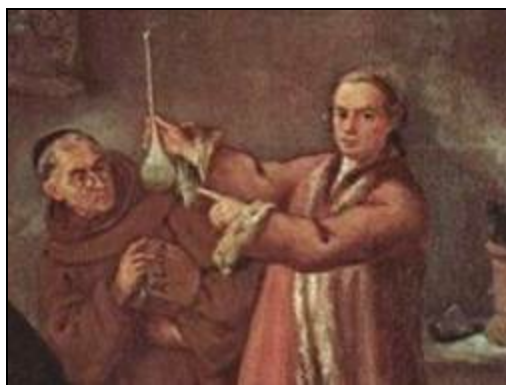
Александр Сетон (анонимный художник)