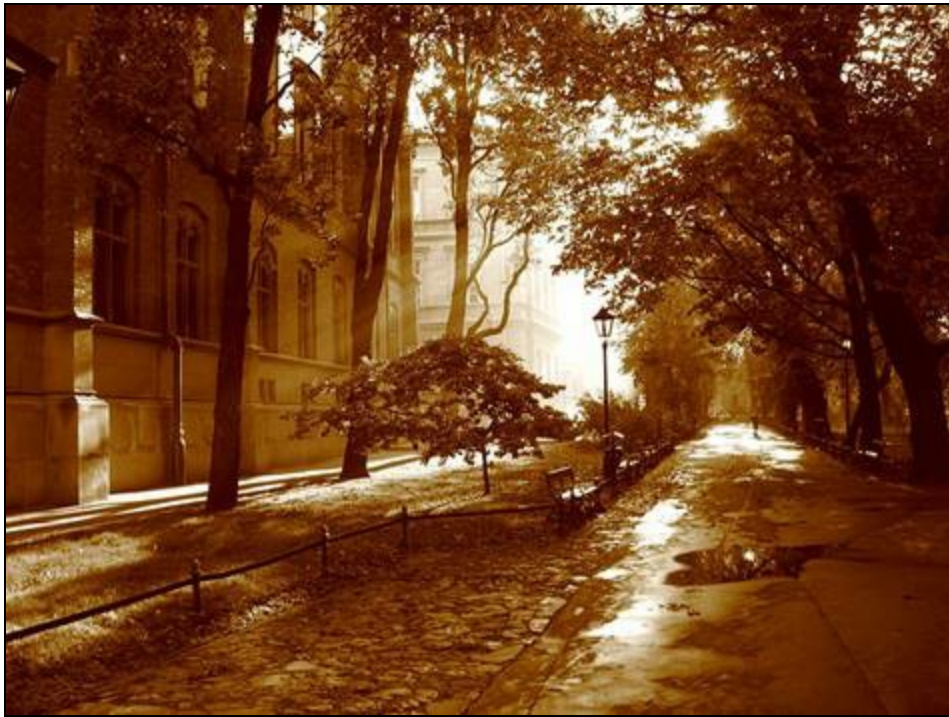
Плянты рядом с Ягеллонским Университетом