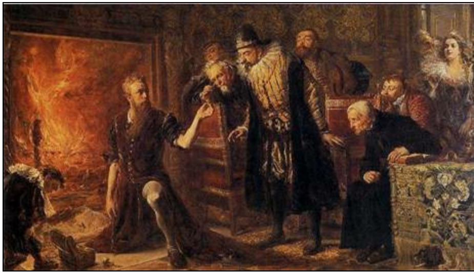
Ян Матейко «Алхимик Сендзивой и Сигизмунд III»