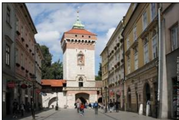
Флорианские ворота и улица Флорианская

Деревья теряли листья. Девушка прошла мимо Барбакана. Ненадолго прикрыла глаза. Без труда представила крепостные стены из красного кирпича и серой извести. Внезапно ей захотелось поглядеть на Флорианские Ворота изнутри.