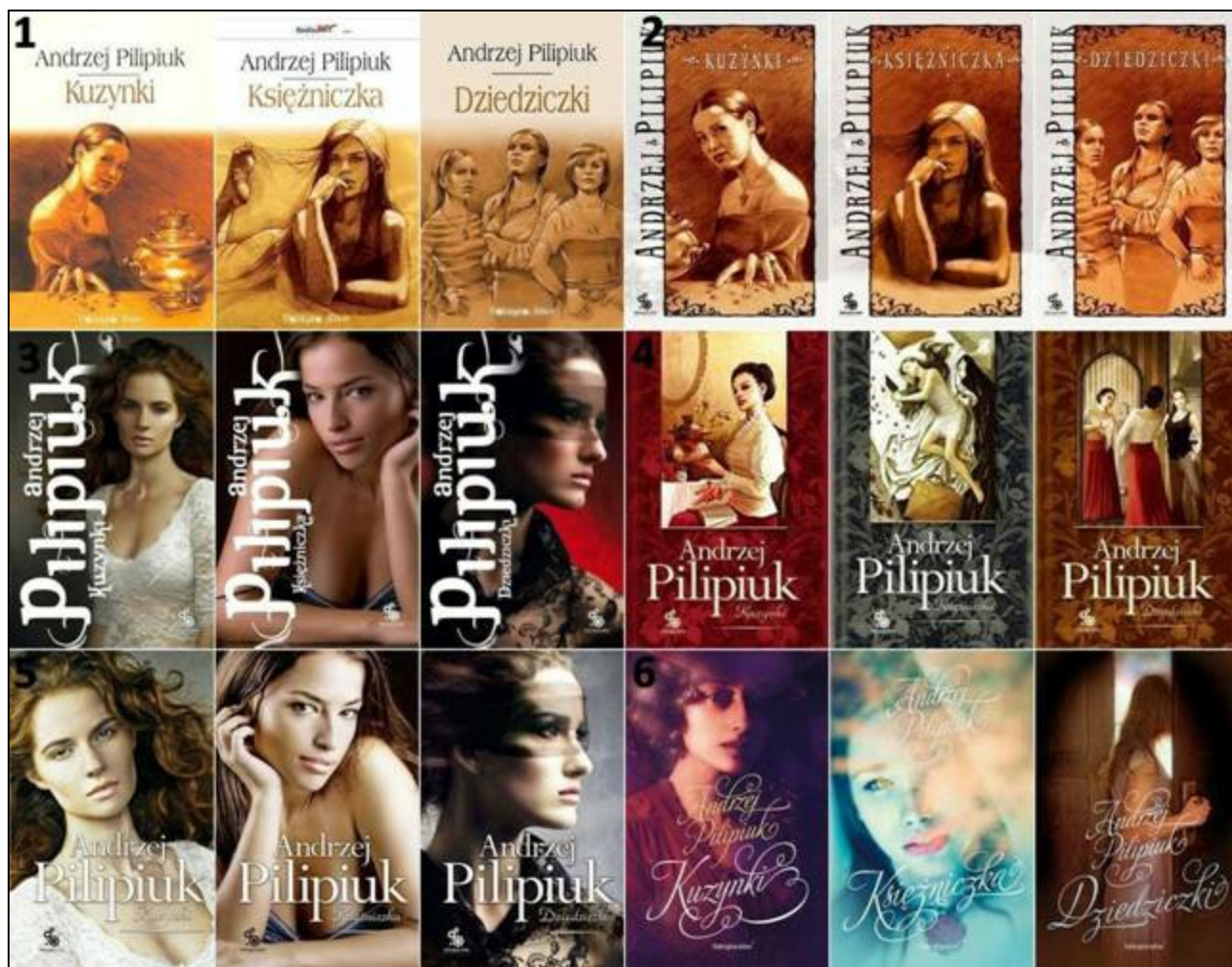
Обложки различных изданий книг о «сестренках» Крушевских, три обложки в правом нижнем углу — издания 2014 года

Ну вот и завершён очередной перевод. Буду ли делать остальные книжки? Скорее всего, нет... Это подарок ко дню рождения, милое, необязательное чтиво, и ничего более. Кстати, рассказ, из которого появилась повесть, я переводил с большим настроением. Тогда, — можете спросить вы, потенциальные читатели этого перевода, — зачем столько примечаний, столько язвительности в тех же примечаниях, отсылок к «пану Автору»? Чем он мне не угодил? Или «дедушка у меня Студебеккер» © Почти цитата из Ильфа и Петрова.