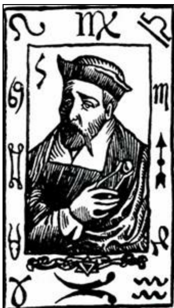
Михал Сендзивой (современная гравюра)