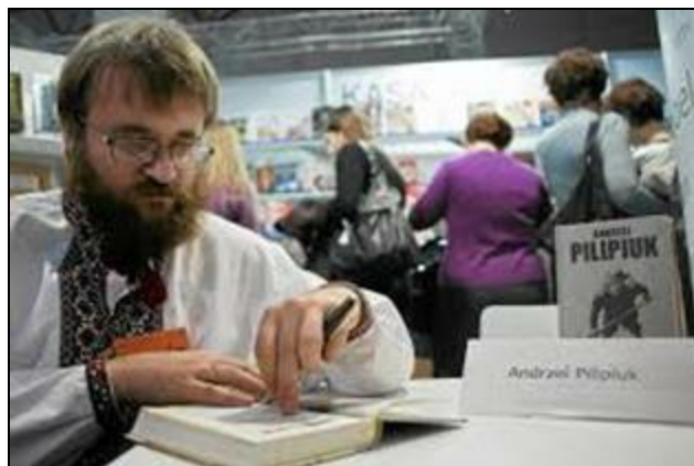
Это и есть Автор, Великий Графоман, Анджей Пилипюк. И как раз в вышиванке.