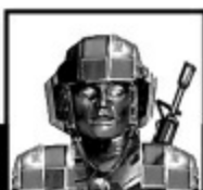
Иллюстрация на переплете В. Нартова