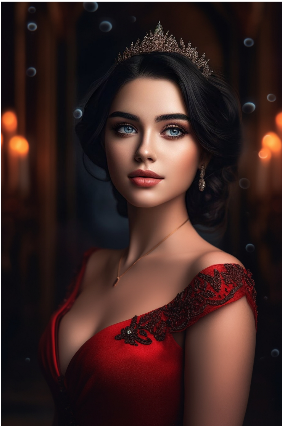
Мейлан в день коронации)