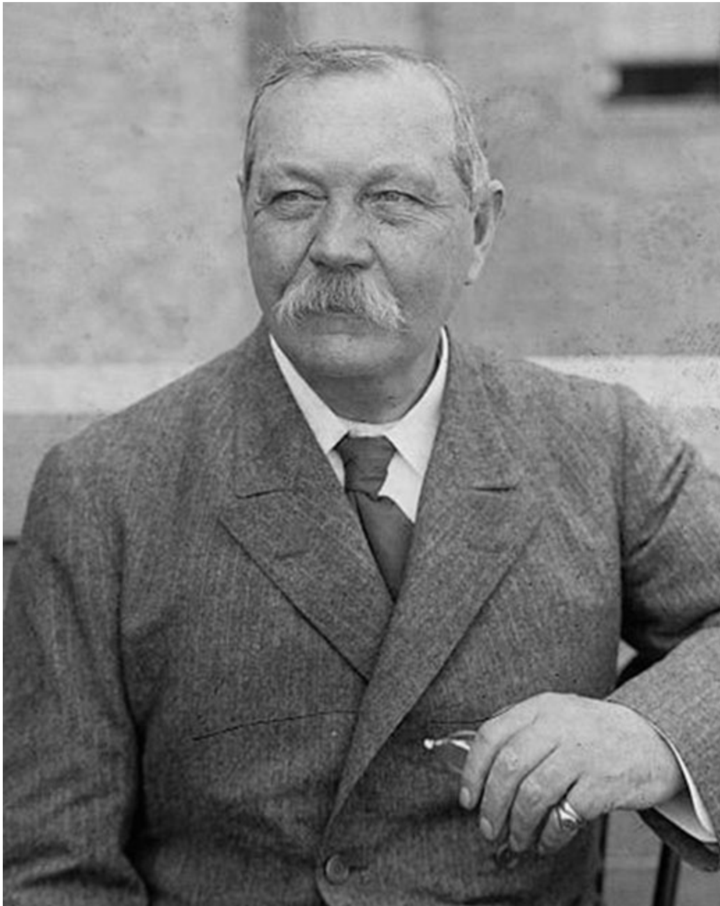
Сэр Артур Конан Дойл